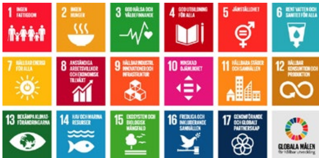
Figur 2: Bildkarta över de 17 globala målen