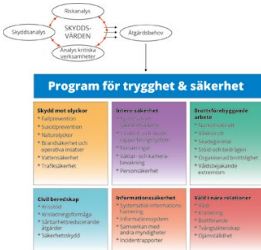
Figur 1: En schematisk bild över framtagandet av programmet.

Jönköping 2030 är den stora kommunen med den lilla kommunens känsla av gemenskap och trygghet – där öppna mötesplatser och ett starkt civillsamhälle bidrar till att skapa en kommun för alla. Kommunen genomsyras av öppenhet, delaktighet och tillgänglighet. Jönköping är en trygg och säker kommun, var än i livet man befinner sig.