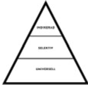
Figur 2 Preventionspyramid

En skyddsfaktor är något som ökar motståndskraften hos en individ. Här går det att särskilt peka på stabila och stödjande relationer inom och utom familjen och de egna egenskaperna. (Meltzer m.fl 2009, Martinez-Torteya m.fl 2009).